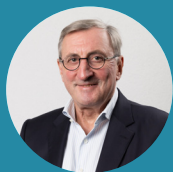
JEAN-MARIE HALSDORF Buergermeeschter